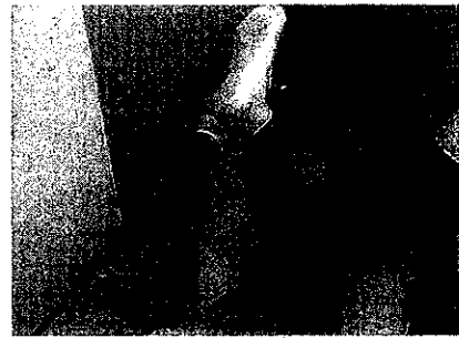
C. 筋を把握したまま可能な範囲まで屈曲させ、再び伸展させる。この一連の運動を把握に対する抵抗感が減じるまで継続する。