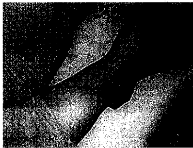
B. 外側ハムストリングスを把握したまま他動的もしくは自動的に膝を徐々に屈曲させる。